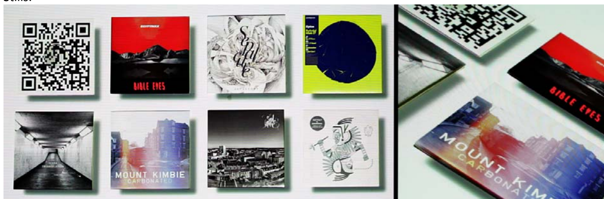
Abb.2: Stills der originalen Covers