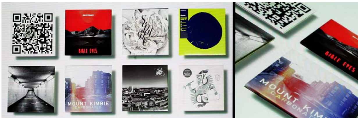
Foto der Anordnung im Raum

Die Tracks stammen von 8 jungen Künstlern, welche im Jahr 2011 mitunter ein neuen Sound geprägt und innovative Ansätze zur Weiterentwicklung gebracht haben. Die Auswahl von Cover und Künstler war etwa gleich gewichtet.